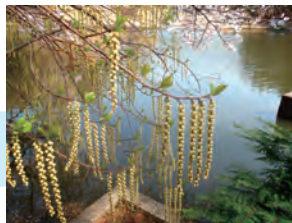
生田緑地のキブシ