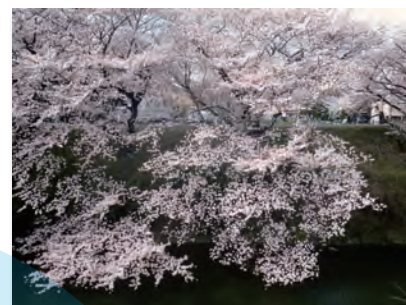
せせらぎ館前の桜