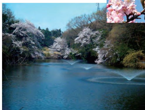
とんもり虫の水源地 生田緑地滝沢ノ池