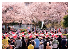
(左上) 和太鼓と篠笛の競演。(上右) 足湯はかわいいお客さんでいっぱい。(左) 稲田中学のチアダンスは超満員。(右) 桜がよく似合う桜井純恵さん熱唱。