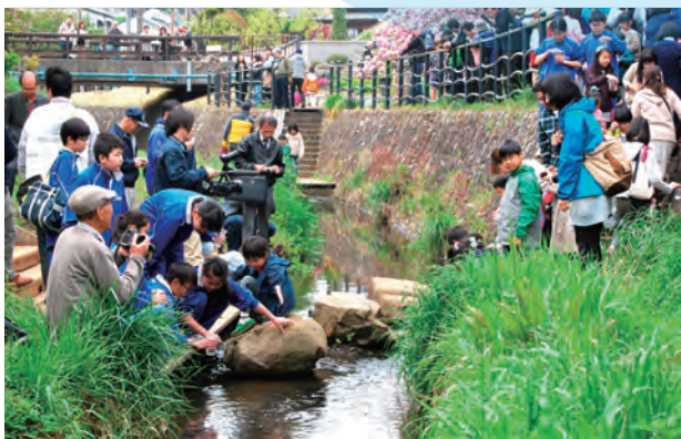
平瀬川鮎の放流と桜祭り